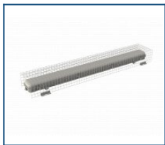
Защитная решетка LPO/LSP (1270*205*120)